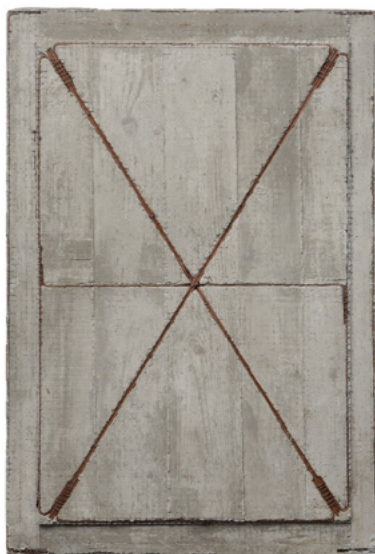
Muri di cemento armato n. 31

Editore Manfredi Edizioni Anno 2019 Lingua Italiano Pagine 64 Formato 16,8 x 24 cm Rilegatura Brossura Filo Refe Cover Cartonato Prezzo Euro 18,00 ISBN 978-88-99519-89-6