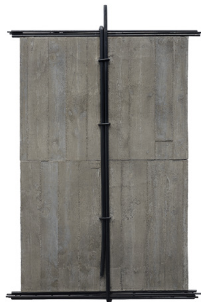
Muri di cemento