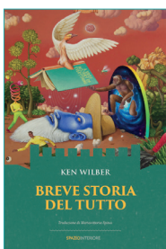
Ken Wilber BREVE STORIA DEL TUTTO € 25 / 416 pagine ISBN 978-88-97864-91-2