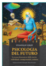
Stanislav Grof PSICOLOGIA DEL FUTURO € 24 / 384 pagine ISBN 978-88-97864-67-7