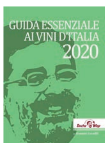
GUIDA ESSENZIALE AI VINI D'ITALIA 2020 by Daniele cernilli

Il terzo è sul rapporto qualità/prezzo, ed è espresso con il simbolo della manina con il pollice alzato, il famoso like , in pratica.