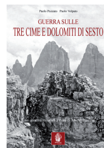
Guerra sulle Tre Cime e Dolomiti di Sesto 978-88-88542-67-6 Euro 21,50

La guerra in montagna e gli alpini sono un binomio ormai imprescindibile. È infatti difficile immaginare un racconto di guerra fra croce e vette innevate che non sia popolato da “penne nere”, muli e ardite imprese alpinistiche. Come nelle celebri pagine di storia raccontate da Paolo Monelli e Antonio Berti in questo volume ritroviamo l’antitesi mai celata fra la drammaticità della guerra e il sincero cameratismo, tra lo spettro di una morte sempre presente e una voglia di vivere mai sopita, fra momenti goliardici e dolorosi addii ai compagni caduti.